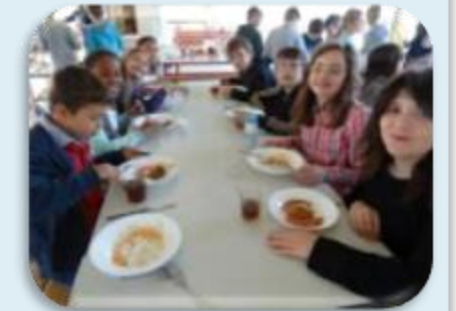
Les élèves de CM1-CM2 b

Nous avons fait un petit déjeuner anglais le 22 avril. Nous avons mangé des pancakes, des haricots blancs, du sirop d'érable, des toasts, du bacon. Nous avons aussi bu du lait, du jus d'orange et du thé. Nous avons mangé tout ça à la cantine de l'école avec l'autre classe de CM1-CM2. La plupart des élèves ont apprécié.