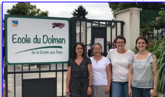
La Directrice avec quelques enseignantes