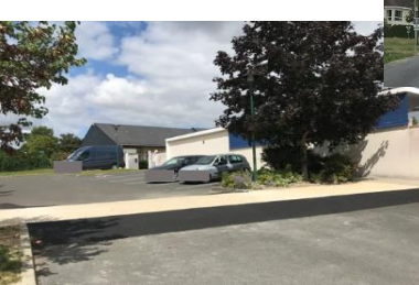
◀ Parking de l'école