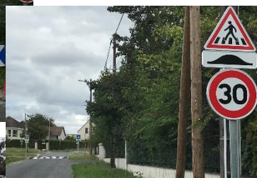
▲ Passage piéton surélevé Route de Cerelles