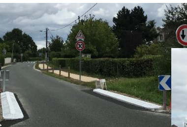
◀ Ecluse et réhausse Rue de la Chabottière

De nombreux aménagements pour la sécurité routière et celle des enfants ont été réalisés pendant cette période estivale. La Commission Voirie répond ainsi aux attentes des habitants, notamment en matière de réduction de la vitesse.