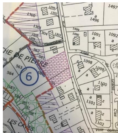
Extrait du PLU approuvé le 28/01/2008 Emplacement réservé en vue de la réalisation d'un programme de logements locatifs sociaux en application de l'article L. 123-2-b du Code de l'urbanisme.

RAPPEL Une réunion sur les dispositifs de la MOBILITE SOLIDAIRE , tant pour les conducteurs que pour les bénéficiaires, sera organisée le samedi 19 mars 2022 à 10h30 dans la salle du conseil de la Mairie.