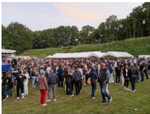
Le comité des fêtes 📷

Une super ambiance avec un temps parfait ! ☀️ Un grand merci à l'ensemble des bénévoles, à la mairie et les agents de la commune, pour leur aide à la préparation en amont, pendant et après cette soirée, sans vous rien n'est possible ! 🙏 Un superbe feu d'artifice qui ravit, encore cette année, petits et grands. 🎆 Et bien sûr, merci à toutes les personnes venues ce soir-là ! Vous avez fait de cette soirée un moment exceptionnel ! ❤️ Tout était au rendez-vous pour que ce soit une réussite, alors encore MERCI et à l'année prochaine !!! 🎉*